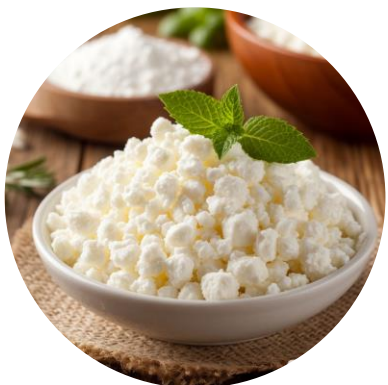
Творог – 50 г