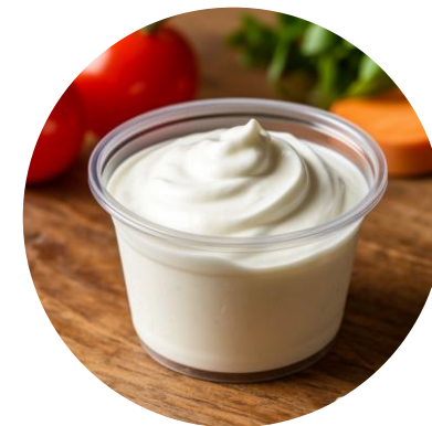
Сметана – 15 г