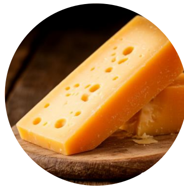
Сыр – 10 г