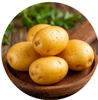
Картофель – 250 г