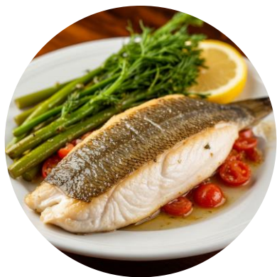
Рыба – 45-60 г