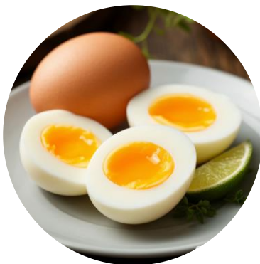
Яйца – 3 шт