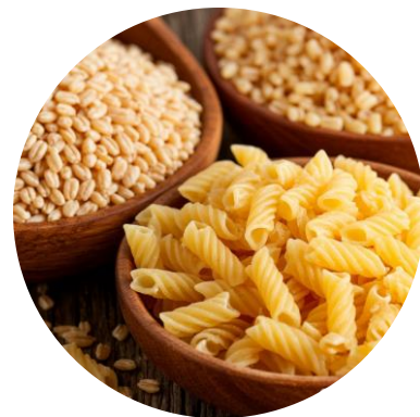
Крупы и макаронны – 50 г